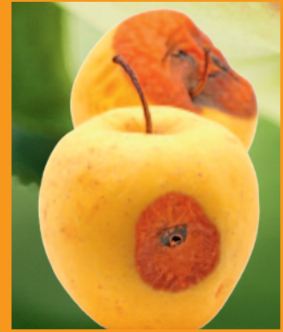
moisissure Penicillium spec.